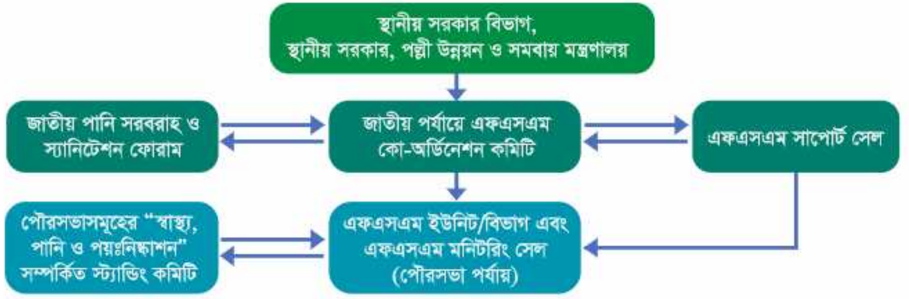
চিত্র ২ - একএসএম কো-অর্ডিনেশন কমিটির কর্ম-সম্পর্ক

স্থানীয় সরকার, পল্লী উন্নয়ন ও সমবায় মন্ত্রণালয় নিম্নলিখিত মন্ত্রণালয়গুলির সহায়তায় ৩২৯টি পৌরসভায় শহরব্যাপী পয়ঃবর্জ্য ব্যবস্থাপনা বাস্তবায়ন পরিচালনায় নেতৃত্ব প্রদান করবে: